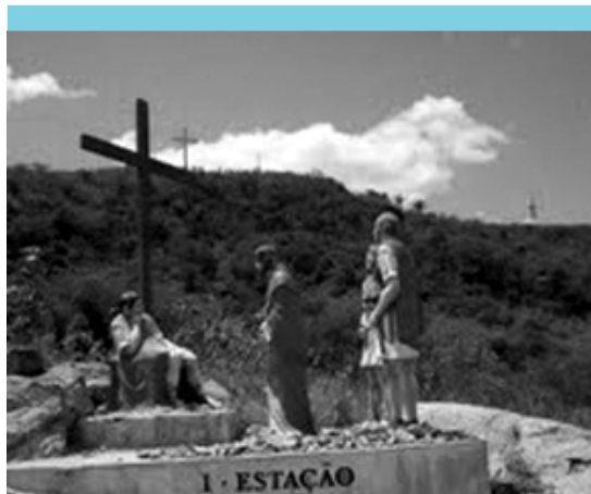
A cena da Primeira Estação, em pleno Brejo da PB

O memorial conta, ainda, com um museu que mostra a vida do frei capuchinho, e, no seu caminho, os visitantes ainda passam pela Via Sacra e pelo Cruzeiro.