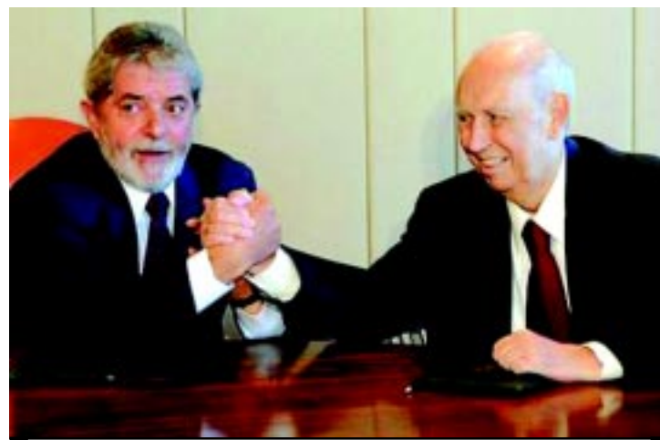
Lula antecipa retorno de viagem a Portugal para participar do velório

Em Coimbra, muito emocionados e com lágrimas descendo dos olhos, a presidente Dilma Rousseff e o ex-presidente Lula lamentaram profundamente a morte de