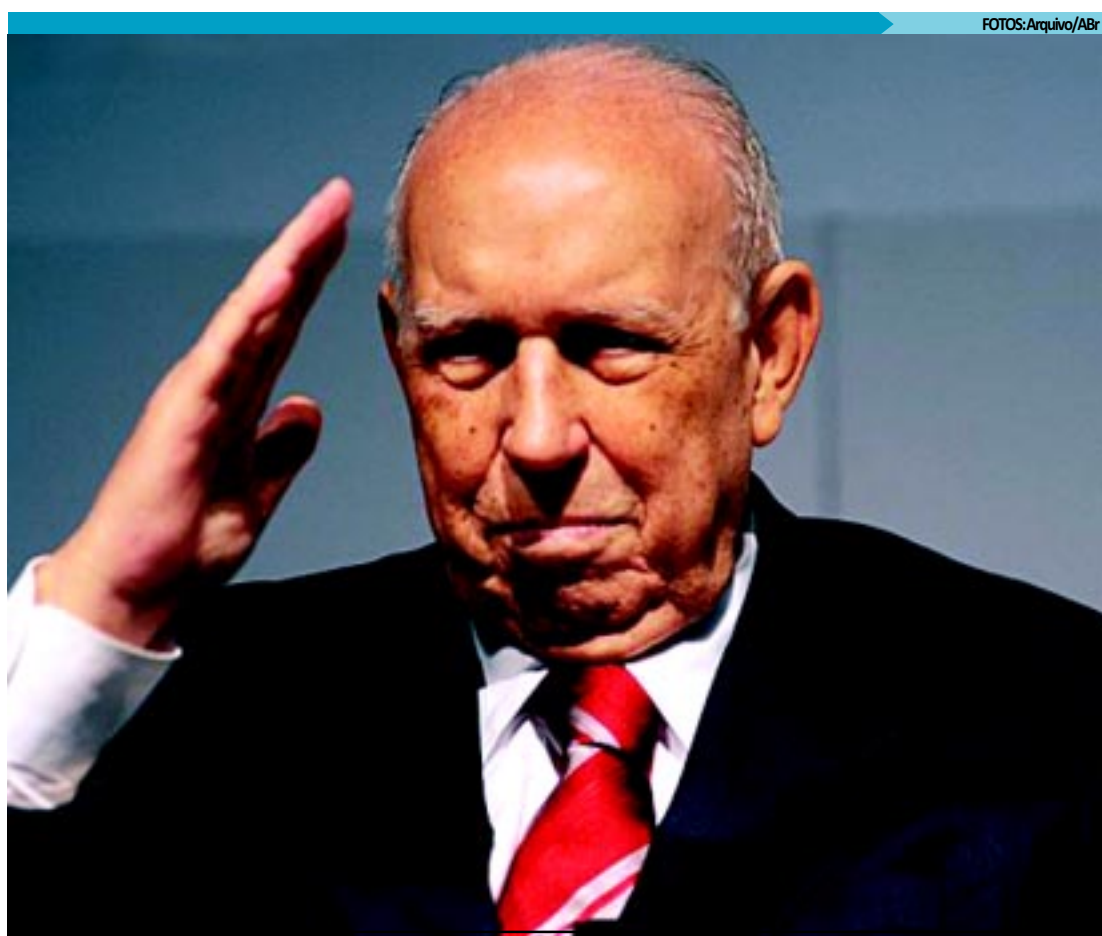
José Alencar é lembrado por políticos como exemplo de coragem, lealdade, amizade e pelo espírito público

Nem sempre o país teve vice-presidente. Nos regimes "revolucionários" e "ditatoriais" do presidente Getúlio Vargas (1930-1945), por exemplo, a Constituição previa que, na ausência do chefe de Estado, outro era escolhido.