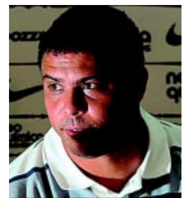
Ronaldo nega agenciamento

De acordo com o documento, a negociação dos direitos federativos de jogadores não está relacionada com o trabalho da empresa, que atua somente com o gerenciamento