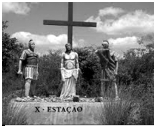
Movimento no local aumenta com a Páscoa