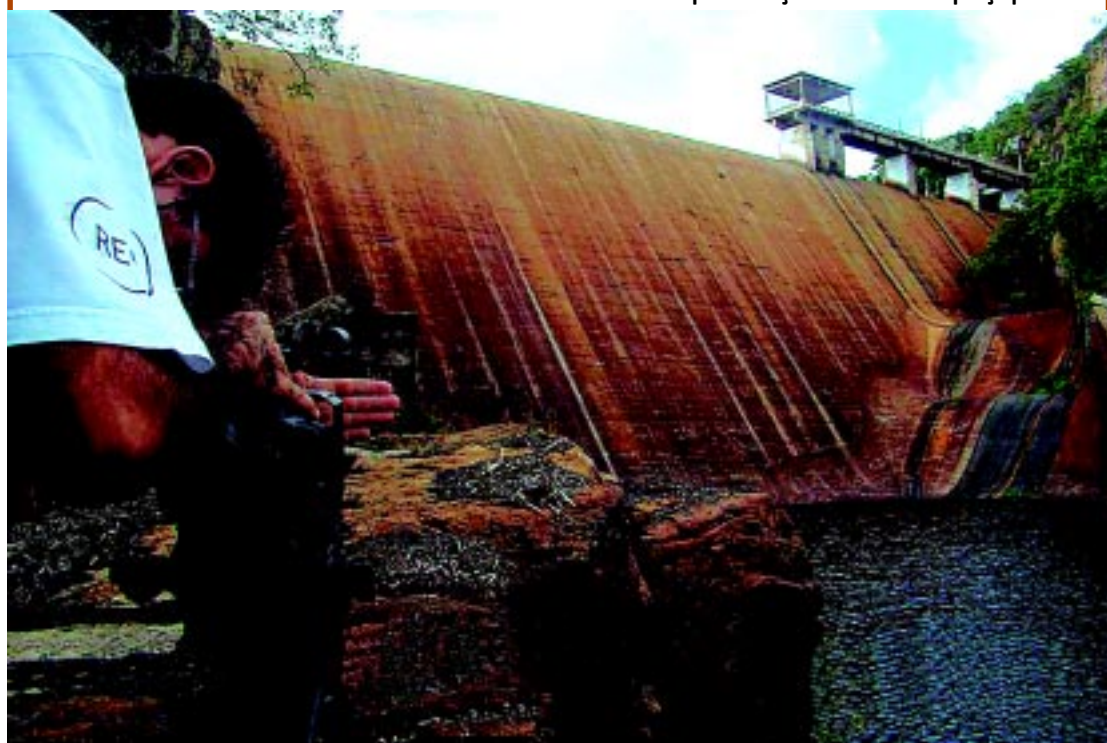
COREMAS Festival divulga cultura paraibana no Sertão PÁGINA 17

Curta Coremas terá início no dia 8 de abril; na programação, exposições gratuitas de curtas-metragens, oficinas e apresentações musicais em praça pública