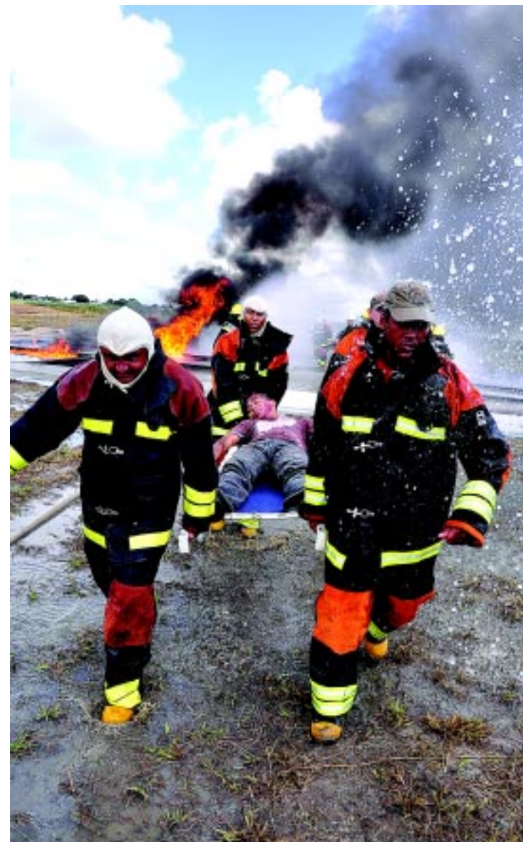
Bombeiros criaram uma falsa queda de avião para treinar a equipe