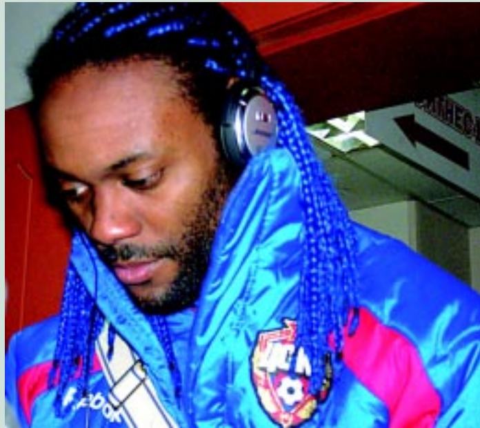
A visita de Love à Gávea, despertou muita expectativa no clube

O ano de 2011 marca o centenário do CSKA e Love é conside-