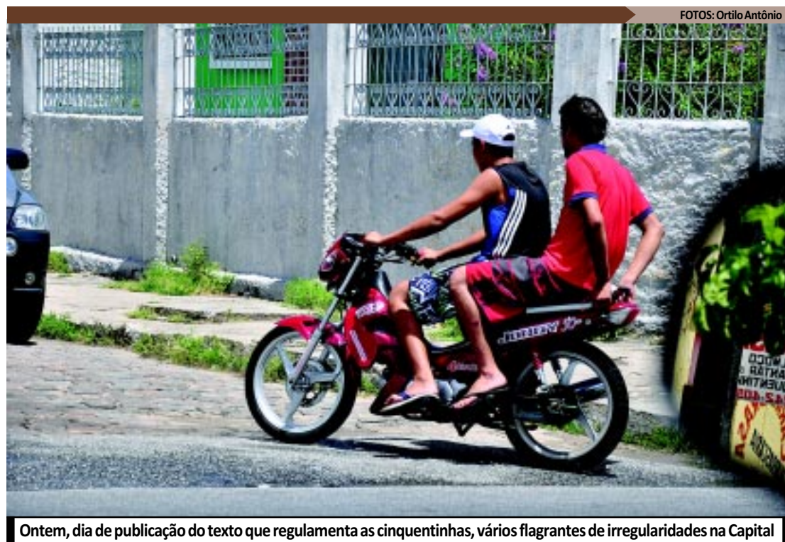
Ontem, dia de publicação do texto que regulamenta as cinquentinhas, vários flagrantes de irregularidades na Capital

Conforme a Portaria, para circular nas ruas da