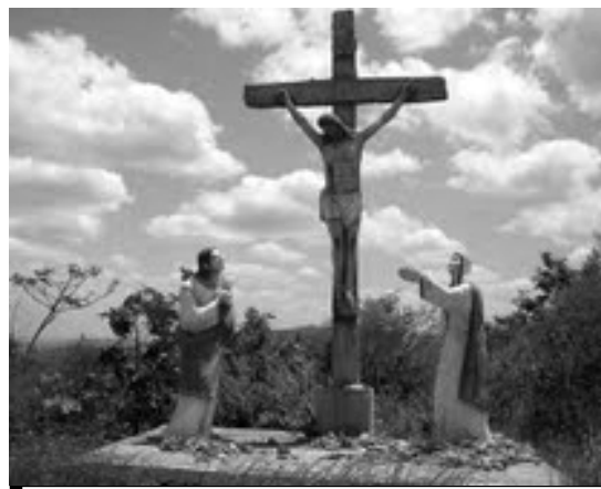
A crucificação de Cristo, ponto forte da obra