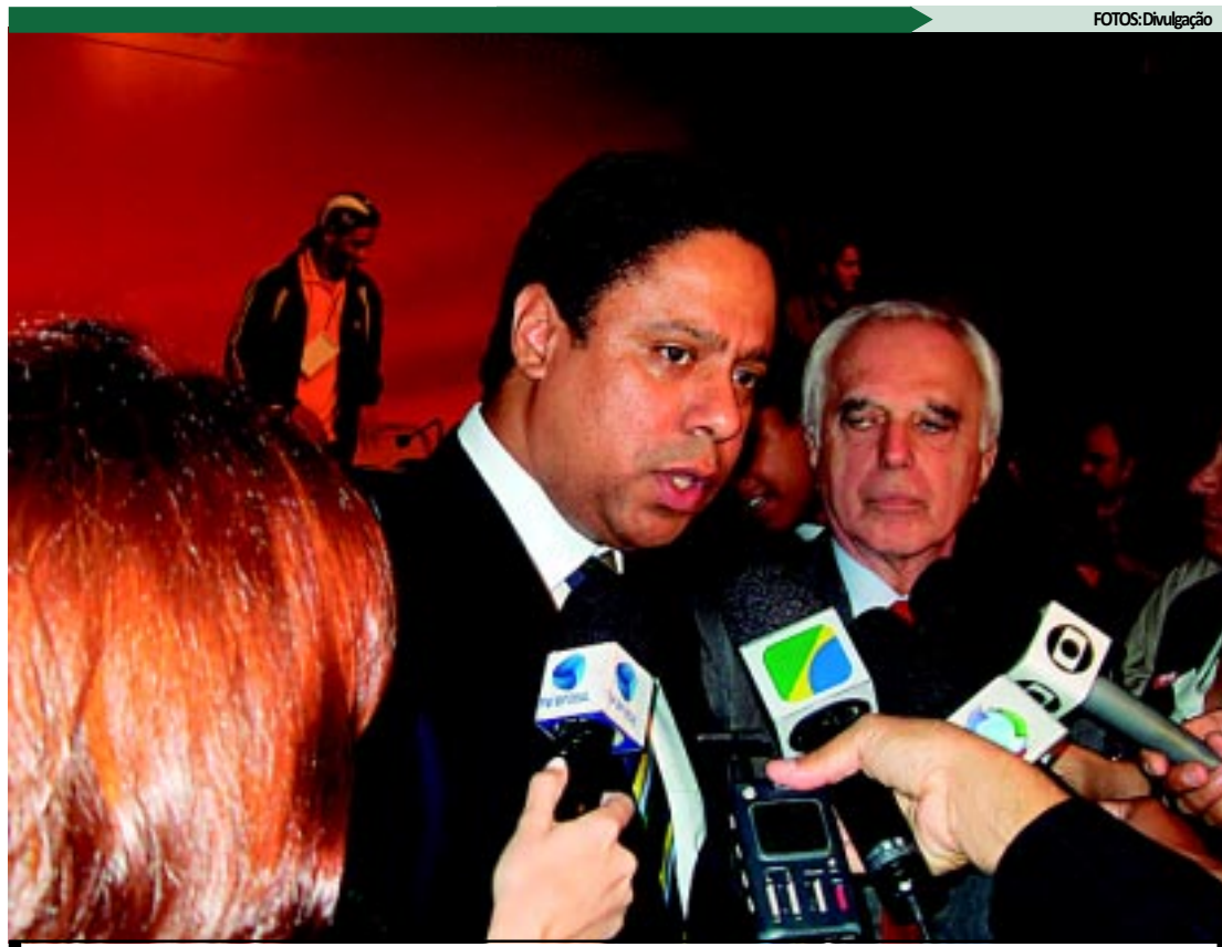
Ministro dos Esportes, Orlando Silva, diz que o Brasil está engajado em fazer tudo dentro do prazo previsto

DIFICULDADES - Silva reconheceu as dificuldades brasileiras em relação a áreas de infraestrutura como aeroportos e mobilidade urbana e recla-