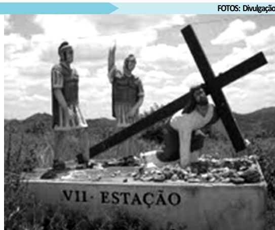
Esculturas feitas por Benjamin Carlos e Eduardo Leite