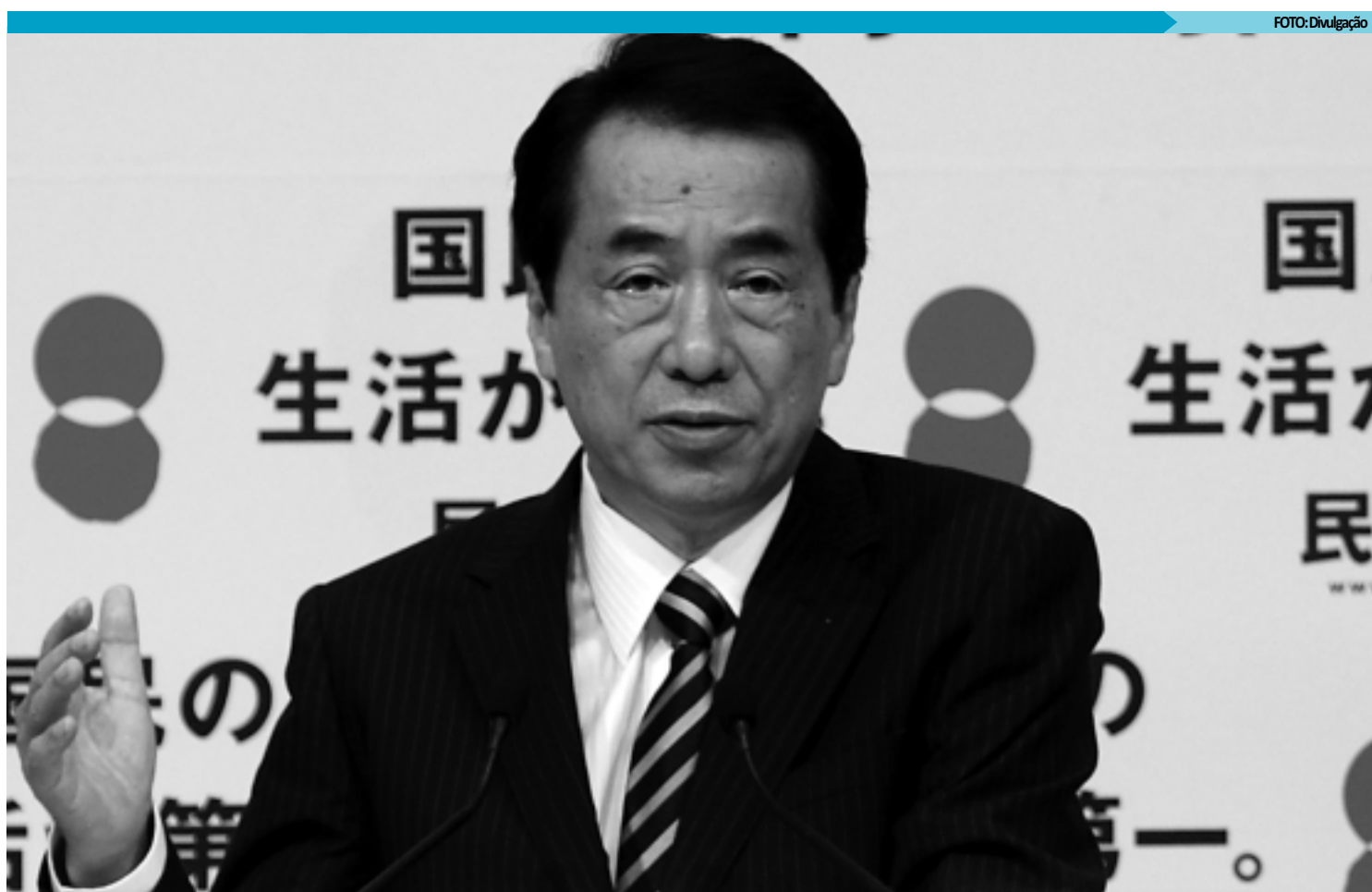
Maior autoridade do país, Naoto Kan disse que a situação na usina permanece "imprevisível", mas afirmou que o governo irá "enfrentar o problema"

O presidente francês, Nicolas Sarkozy, atualmente líder do G-8 e do G-20, irá viajar ao Japão amanhã. Segundo seu escritório em Paris, a visita será uma mostra de solidariedade. As informações são da Dow Jones.