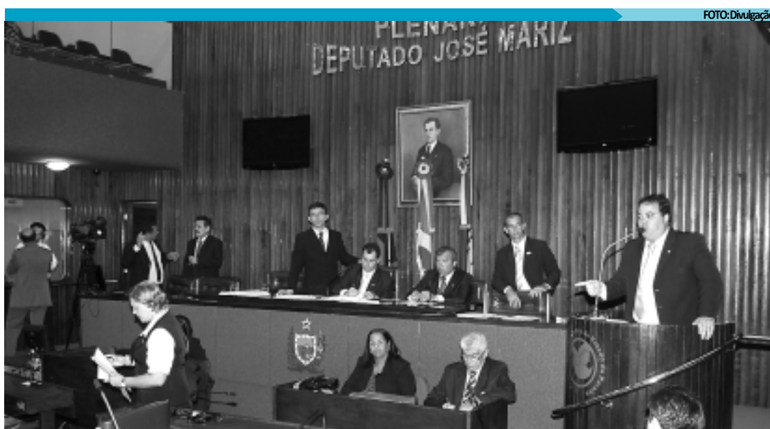
Plenário discutirá medidas provisórias do Executivo, projetos de lei complementar e projetos de lei

A medida provisória em questão autoriza o governo do Estado a remanejar R$ 12 milhões que seriam destinados à reconstrução da barragem de Camará, por entender que os recursos poderão voltar para o Governo Federal, porque a barragem objeto da matéria está sub-judice. Segundo a MP, R$ 7 milhões seriam remanejados para o Centro de Convenções da Capital e, os restantes R$ 5 milhões, destinados a reconstrução de outras barragens