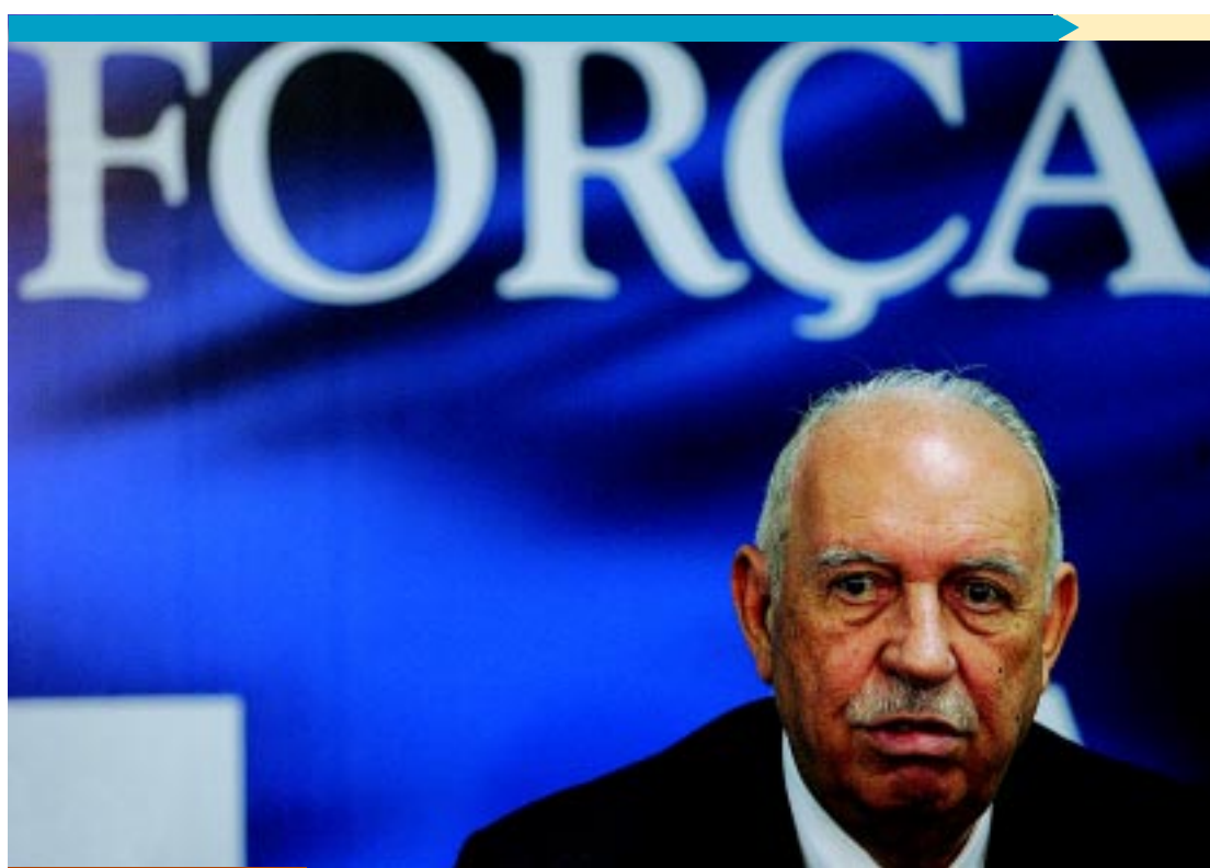
JOSÉ ALENCAR Depois de uma luta de 13 anos, empresário faleceu ontem em SP PÁGINAS 5 E 6

traídas até dezembro de 2010. Quem preferir o parcelamento tem direito a dividir o valor devido em até 24 meses. A Secretaria da Receita garantiu que não irá prorrogar o prazo para adesão. PÁGINA 12